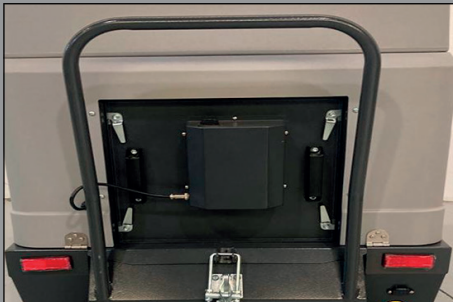
Sacudidor eléctrico del filtro de aire