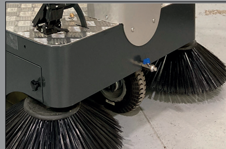
Sistema de nebulización delantero