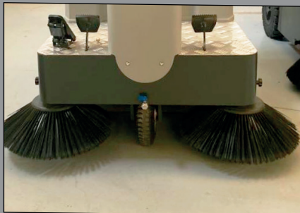
Cepillo lateral izquierdo y derecho

Los equipos BHIOR incorporan el equipamiento premium más completo de serie en toda su gama: