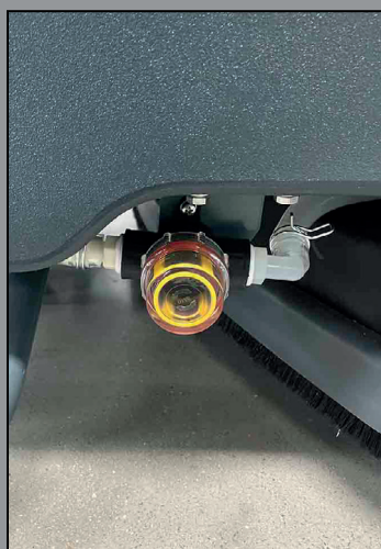
Fácil acceso al filtro metálico del agua limpia.