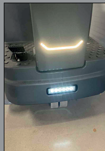
Luces de trabajo LED delanteras.