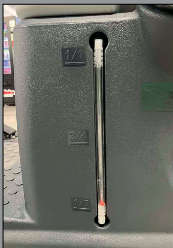
Visor del nivel del depósito de agua limpia.