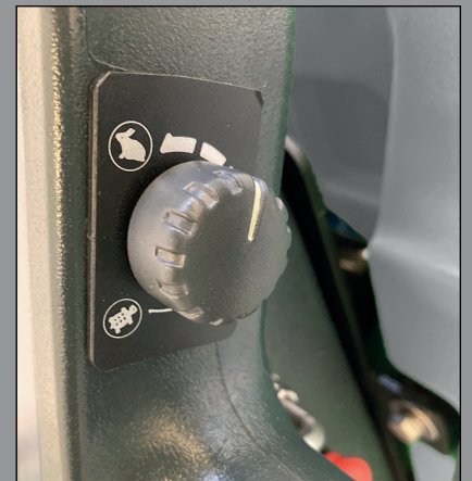
Regulador de la velocidad