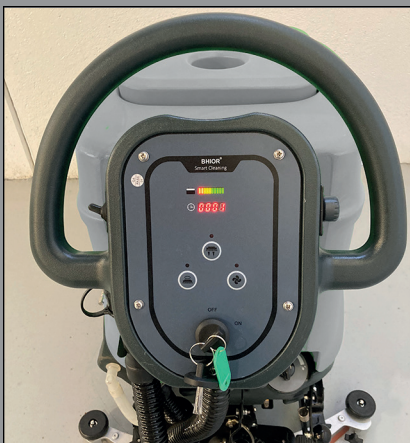
Panel de control ergonómico