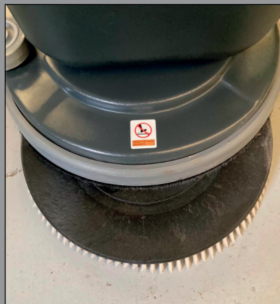
Extracción automática del cepillo