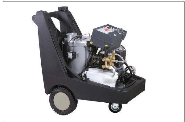
Panel de control de 24 V 24 V Control Panel