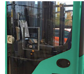
Intercomunicador bidireccional para cabina de almacenamiento en frío