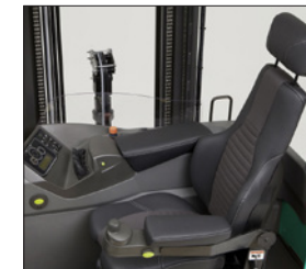
Reposacabezas para asiento