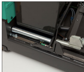
Batería sobre rodillos