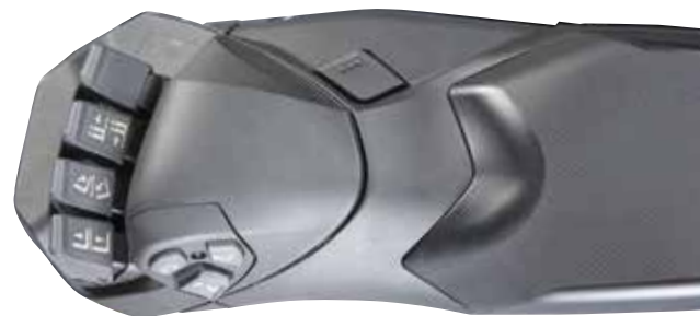
Reposabrazos ajustable ErgoCentric con control táctil integrado

Los controles son accionados por resorte con una respuesta natural: basta con pulsarlos suavemente para que su control sea más preciso.