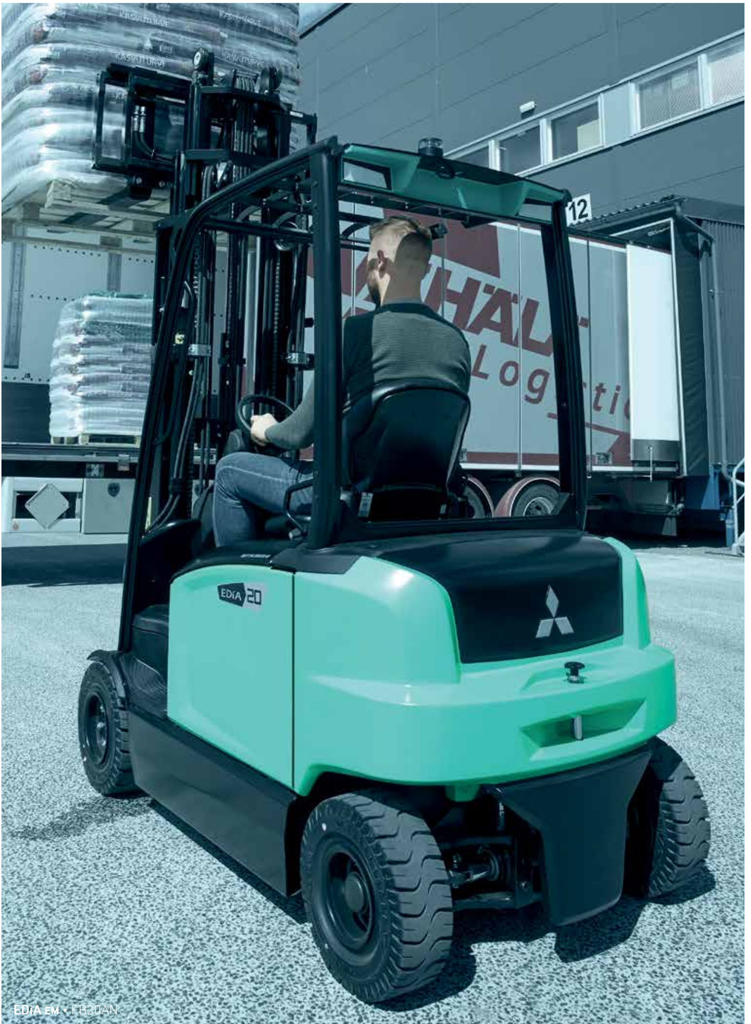
ED1A EM • FB20AN