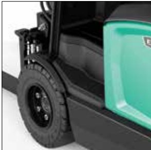
Fácil acceso para subir/bajar

Alimentación de 48V AC 1.4 – 2.0 toneladas