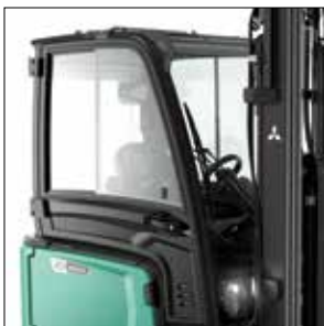
Amplia gama de cabinas