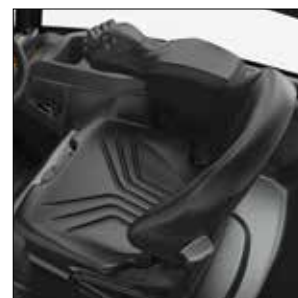
Asiento y reposabrazos ergonómicos