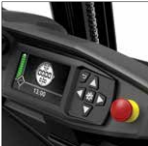
Pantalla clara y luminosa