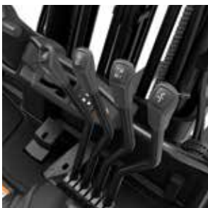
Controles de palanca manual

Le presentamos EDiA EM. Es la carretilla más inteligente del mercado y una de las más duraderas. Repleta de funciones, ofrece la maniobrabilidad, potencia y fiabilidad que usted espera de una Mitsubishi.