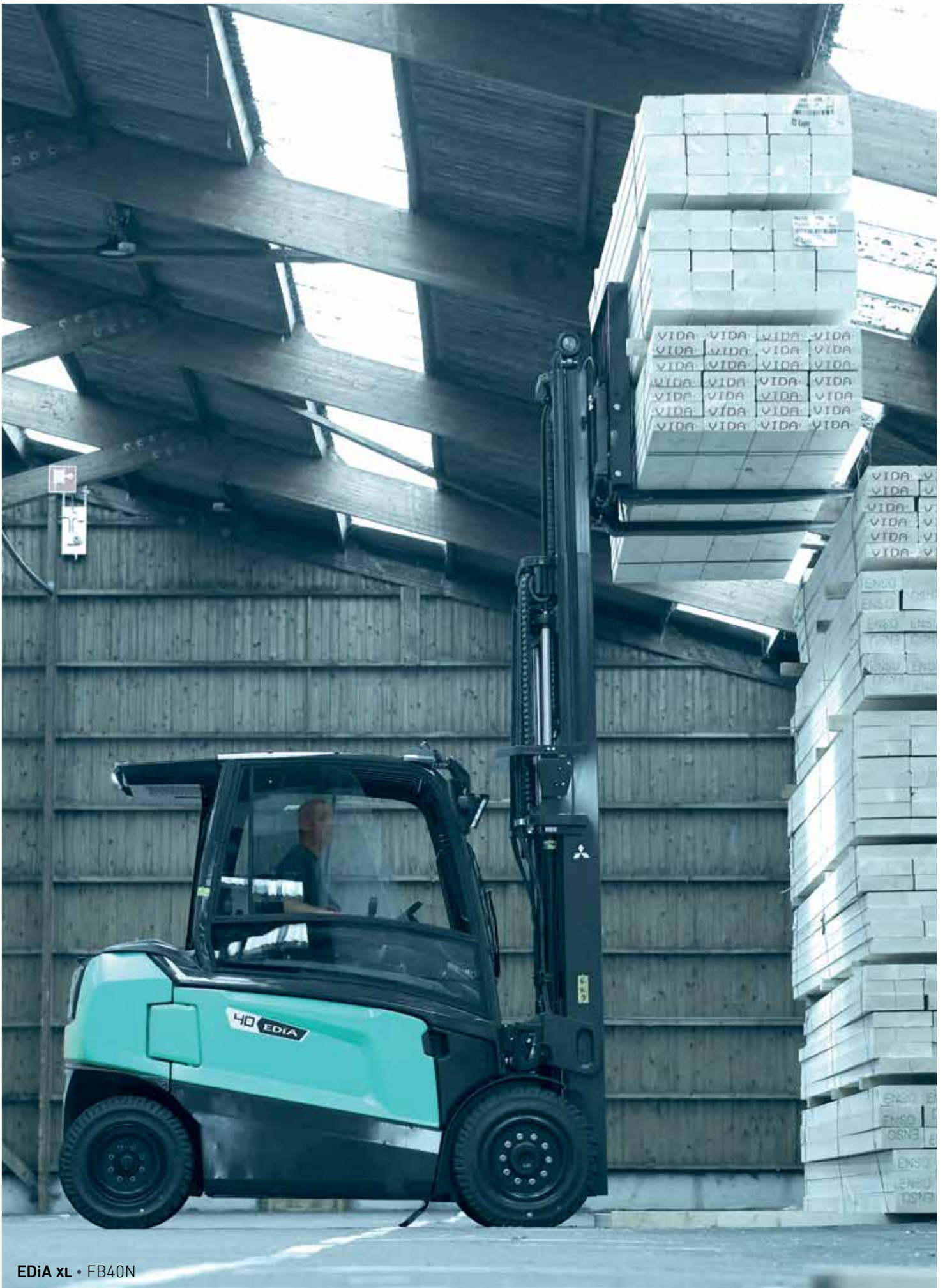
EDiA XL • FB40N