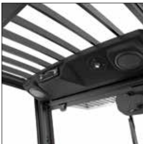
Tejadillo protector de amplia visibilidad

Todos sabemos que, si un operario está cómodo, será más productivo. La EDiA XL incorpora una cabina sellada con caucho que minimiza las microvibraciones, siendo el nivel global de ruido en el interior de la cabina de tan solo 65 dB.