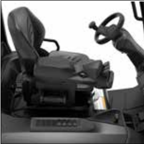
Cabina totalmente equipada

Alimentación de 48V AC 1.4 – 2.0 toneladas