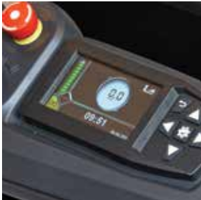
Pantalla informativa nítida

Alimentación de 80V AC 2.5 – 3.5 toneladas