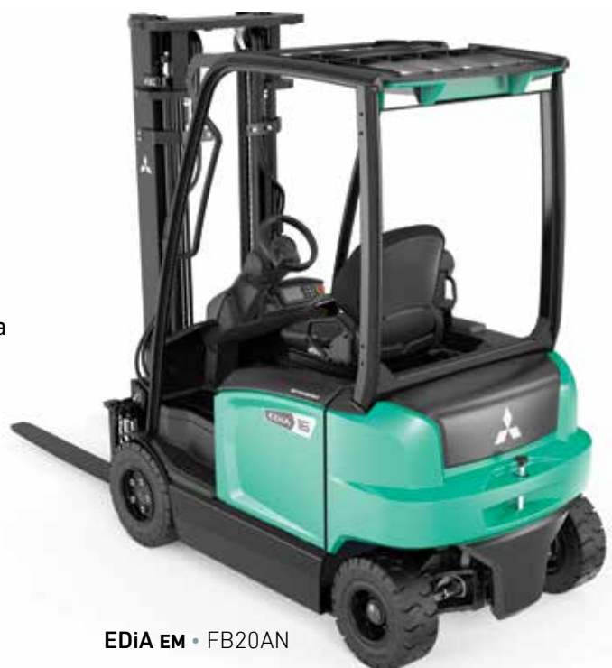
EDiA EM • FB20AN

Reduce la velocidad de forma dinámica al comienzo y durante el giro, lo que le permite mantener la máxima estabilidad en las curvas.