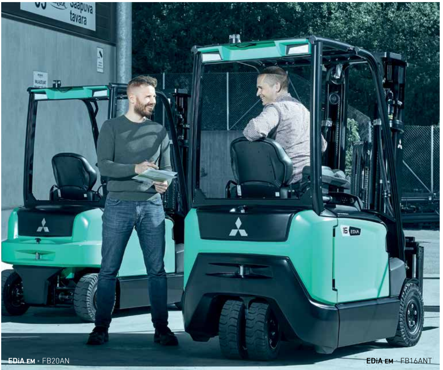
EDiA EM • FB20AN