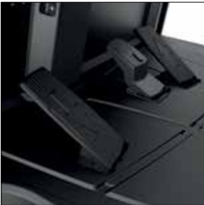
Pedal de dirección opcional