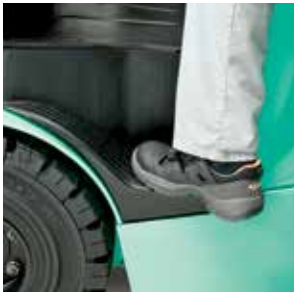
El escalón extra grande