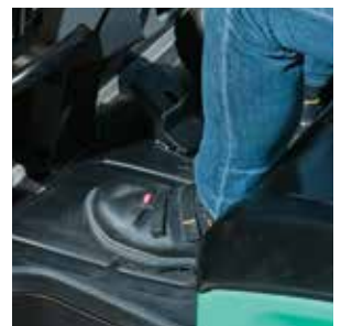
Espaciosa zona para pies