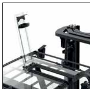
Opción de segmento de grúa