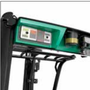
Juego de iluminación opcional