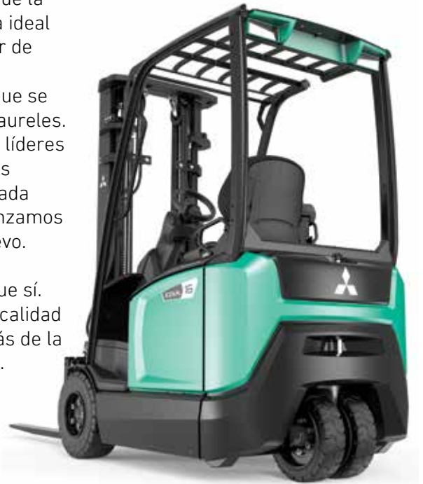
EDiA EM • FB16ANT

Todo tiene que estar a la altura de su nombre: EDiA . El Diamante Eléctrico.