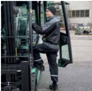
Fácil acceso para subir/bajar