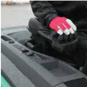
Trabaja en todo tipo de condiciones climáticas

Alimentación de 80V AC 2.5 – 3.5 toneladas