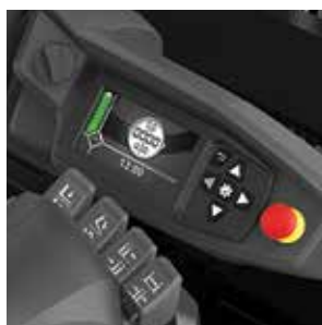
Control por fingertips