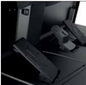
Diseño de doble pedal opcional