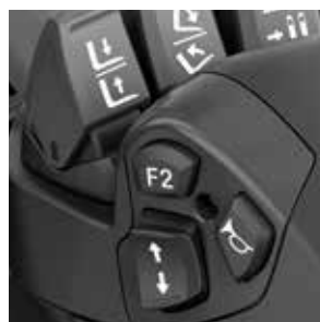
Botón F2 de control con el pulgar