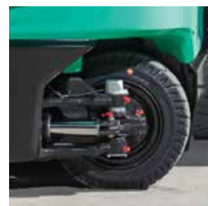
Eje de dirección a >100°