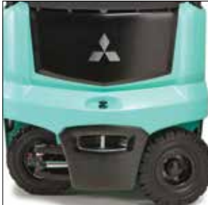
Eje trasero con dirección de 100°