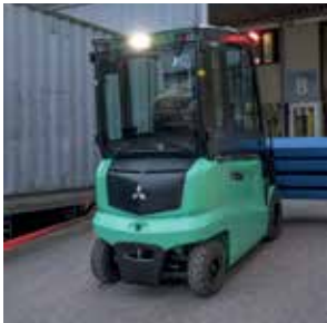
El escalón extra grande

Todo en la EDiA inspira confianza. Nuestro equipo de diseño ha logrado crear un vehículo robusto pero ágil, tecnológicamente avanzado pero de manejo completamente intuitivo. EDiA proporciona confianza para trabajar sabiendo que la carretilla estará siempre a la altura de la tarea. Con dirección a las cuatro ruedas y una impresionante capacidad residual, permite disfrutar de las prestaciones de una carretilla grande en espacios reducidos. Y con la función AutoBoost, nunca tendrá la sensación de que le falta potencia.