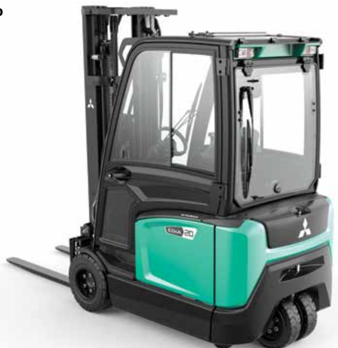
EDiA EM • FB20AN

Permite que el operario mantenga la carretilla en constante movimiento, ahorrando segundos en cada vuelta.