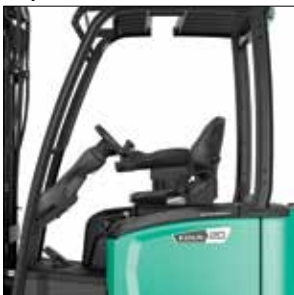
Gran "pórtico de entrada"