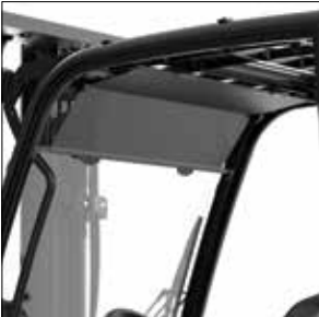
Visera parasol opcional