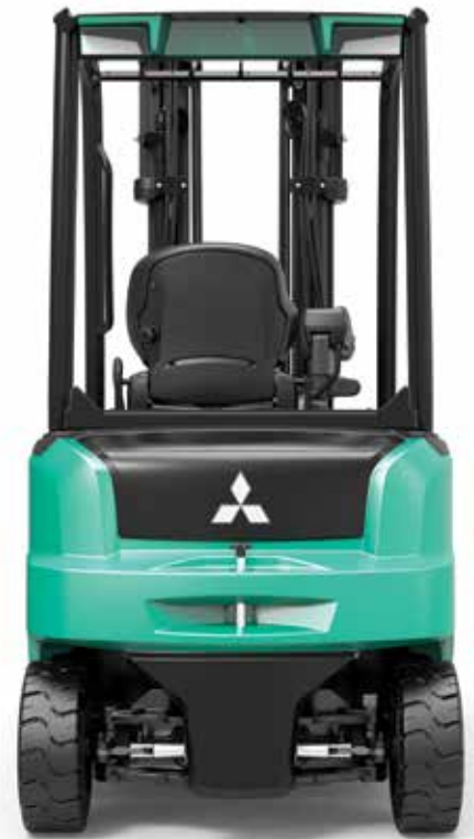
EDiA EM • FB20AN

Piense en lo más importante, y el resto vendrá solo.