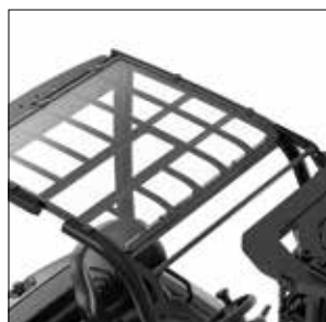
Techo acrílico opcional