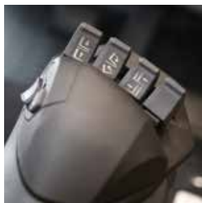
Control táctil sensible